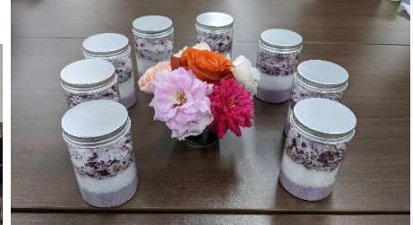
完成した「ばらのバスソルト」